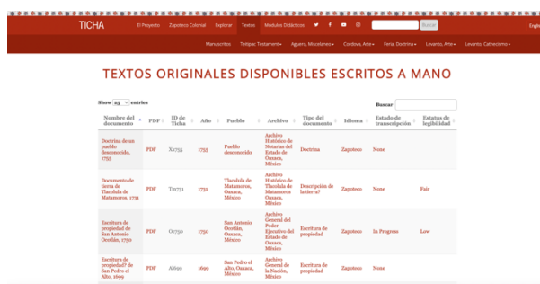
Figura 2. Ticha, página de manuscritos. Fuente: captura de pantalla del sitio.

El menú de Textos permite al usuario tener una idea general del contenido, manuscritos e impresos, y conocer los campos a través de los cuales acceder a los documentos: fecha, año, lugar de origen, archivo, género, idioma, estado de la transcripción y legibilidad.