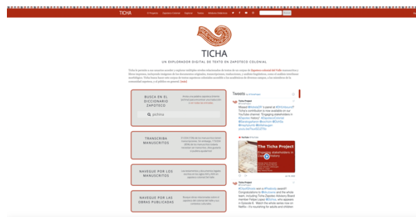
Figura 1. Ticha, página inicial.

Ticha es un recurso digital bilingüe (inglés-español), colaborativo e interdisciplinario conformado por investigadores y estudiantes de lingüística, antropología, historia, filología, ciencia informática, así como hablantes nativos y expertos en cultura zapoteca. El sitio presenta facsímiles de los documentos (manuscritos y libros impresos), transcripciones, traducciones al inglés y al español, análisis lingüísticos y morfológicos, textos de apoyo, bibliografía en zapoteco y un vocabulario en inglés. Además, hay vínculos a diccionarios y recursos para el estudio de la lengua zapoteca, así como videos explicativos y testimoniales, gráficos, mapas y estadísticas. Los datos son analizados en FLEx (Fieldworks Language Explorer), una herramienta de análisis léxico y gramatical, con estándares de TEI (Text Encoding Initiative).